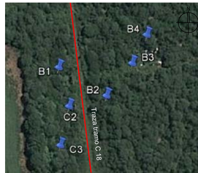
UBICACIÓN DE LOS BARRENOS Y CALICATAS