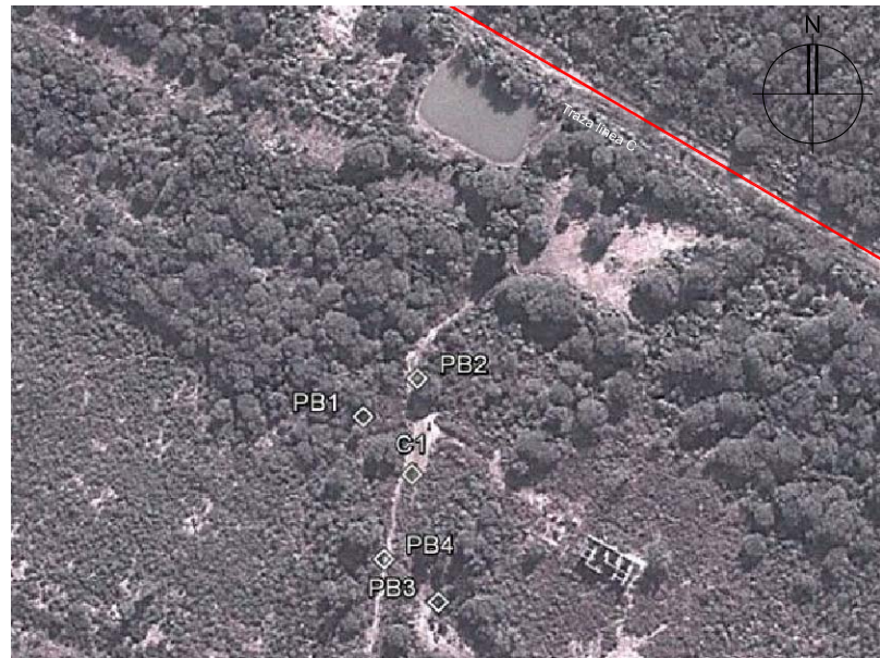
UBICACIÓN DE LOS BARRENOS Y CALICATAS