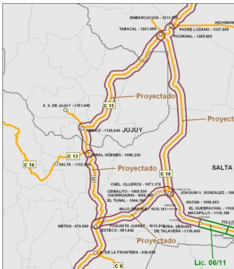
Figura 1: Mapa del sector a estudiar

5 El objetivo del presente pliego es el de establecer las pautas mínimas para poder determinar las propiedades, la capacidad portante y, en caso de ser requeridos, los trabajos de mejoramiento necesarios para el correcto comportamiento de la plataforma del ramal C12-C18.