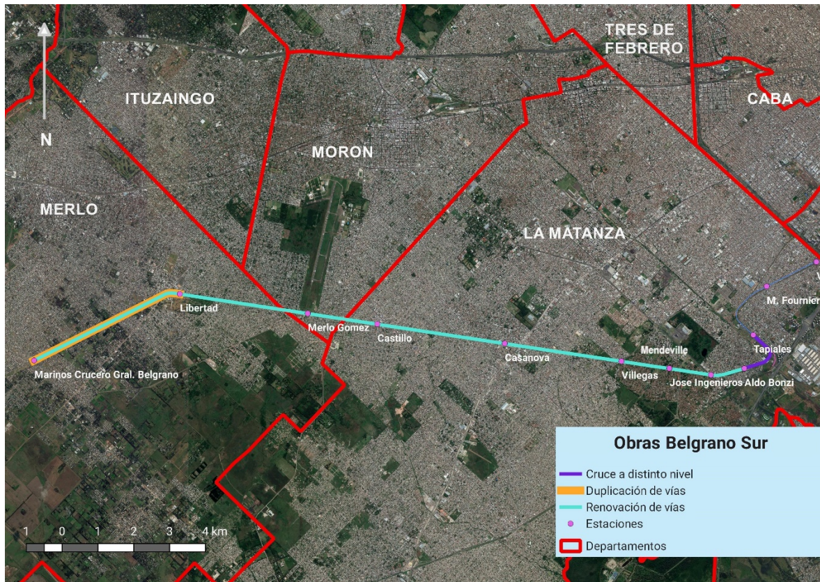
Figura 1: Mapa con el tramo ferroviario en que se ejecutarán las obras y sus demarcaciones.

A los fines licitatorios las obras ferroviarias han sido divididas en cinco (5) renglones distintos, dando así lugar a cinco (5) contratos independientes.